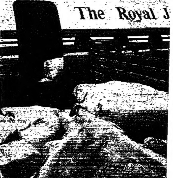
جانب من المساعدة الطبية الاربانية التي شحت امس الى ايران على من طنقرة خاصة « تصوير ١ و ١ »

وقرر ان برنامج الغذاء العالمي قرر المساهمة المالية الاربانية التي شحت امس الى ايران على من طنقرة خاصة « تصوير ١ و ١ »